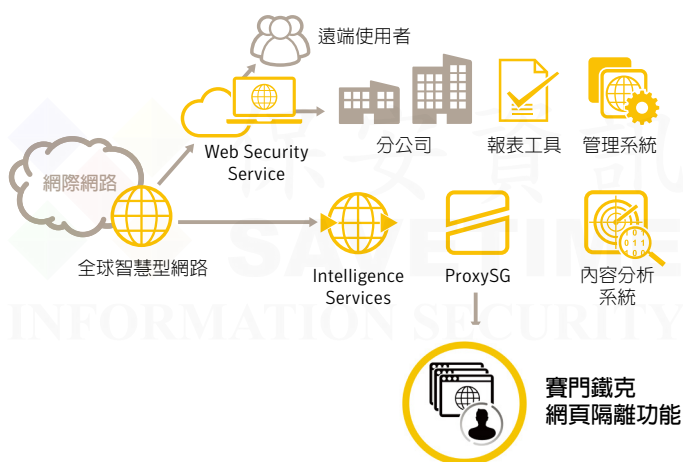
圖二：賽門鐵克網頁安全閘道及網頁隔離的運作架構

賽門鐵克 Secure Web Gateway 加入網頁隔離功能後，可以針對未分類和潛在風險網站提供安全且不受限制的網頁存取功能，進而充分提升企業及使用者生產力，同時減少和管理網頁存取政策、支援問題單、安全警示和鑑識調查相關的營運負擔和複雜性。